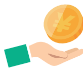
代行手数料 (ナンバープレート再取得に係る費用)