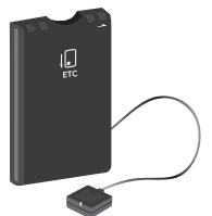
ETCセットアップ 手数料