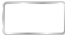
ナンバーフレーム 費用