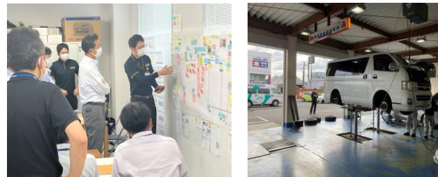
<物と情報の流れ図活用・対策実施>