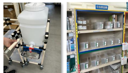
<ものづくり・保管棚改善>